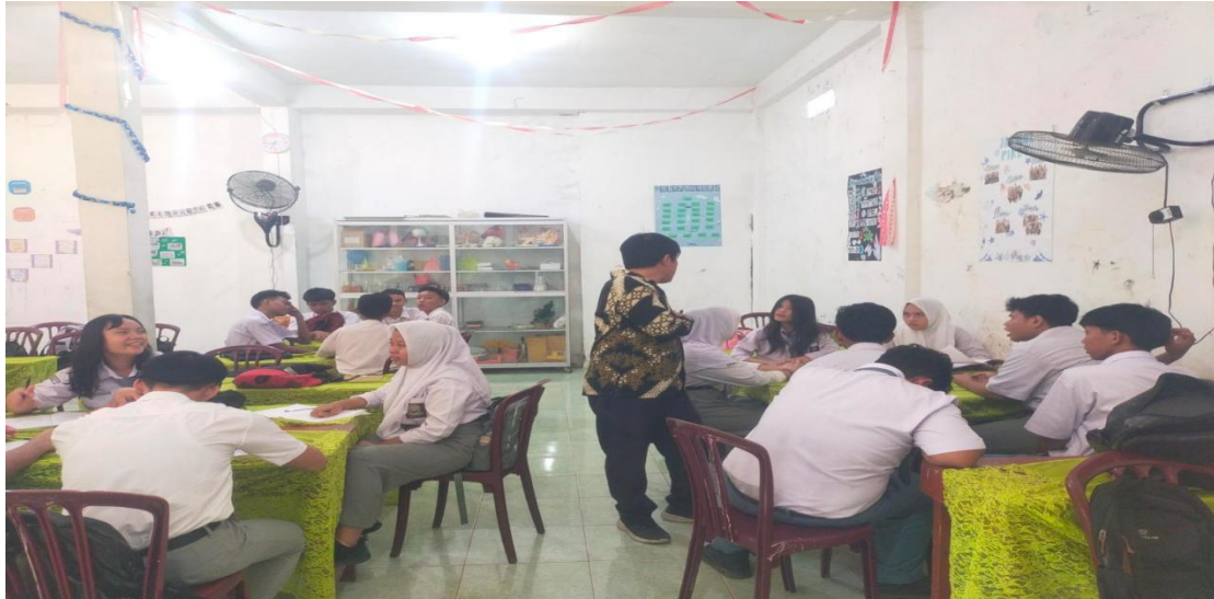
Gambar 2. Kegiatan pelatihan kreatif berbasis diskusi kelompok untuk meningkatkan kompetensi berbahasa Inggris siswa di SMA Nurcahaya Medan.